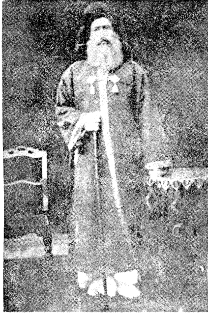
المولى مطاب بن نصر الله المشعشي